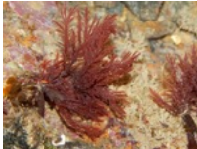
Algue marine. Pikea californica Harvey

A voir plus bas quelques variétés de spécimens portant le nom de Pike.