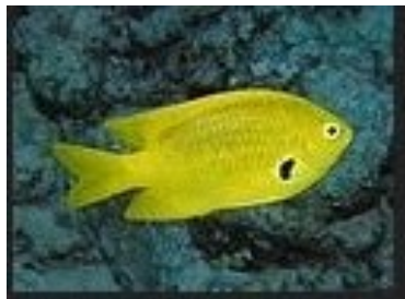
Poisson tropical. Pomacentrus pikei