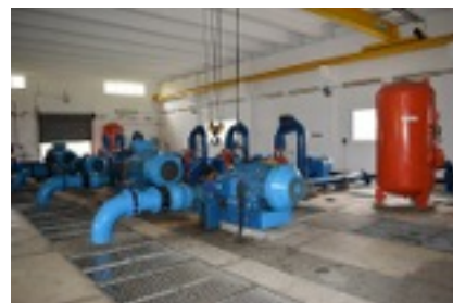
Centre d'épuration d'eau potable à La Marie. Les bassins, le nettoyage avant le remplissage d'eau et les machines.