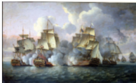
Couverture du nouvel ouvrage de Tugdual de Langlais.

Pour plus d'information s'adresser directement à l'auteur : tugdual.delanglais@wanadoo.fr